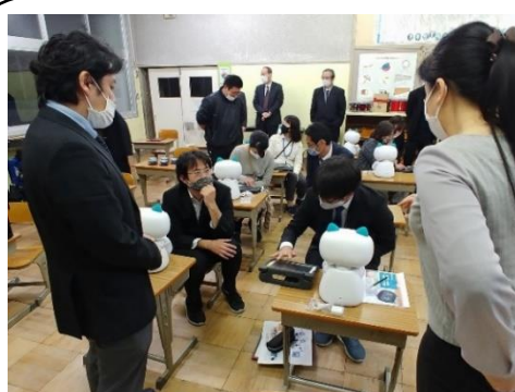
不安な点や悩みを質問しました。