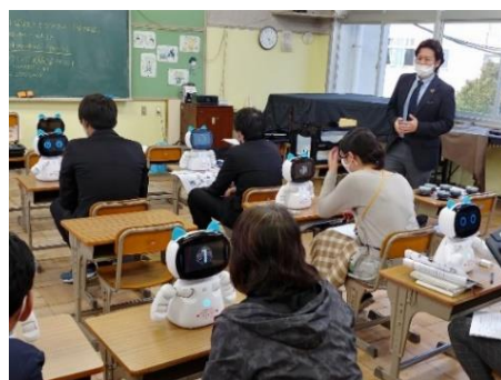
【事業者の説明を真剣に聞く様子】

シンフォニア・プロパティーマネジメント株式会社、 NUWA ロボティクス JAPAN 株式会社、 近藤産興株式会社